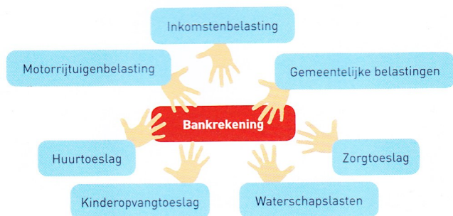
Figuur 3: bij toepassing van de overheidsvordering kunnen verschillende vorderingen naast elkaar worden geïncasseerd

De verschillende nieuwe bijzondere bevoegdheden van schuldeisers hebben tot gevolg dat deze schuldeisers in staat zijn om een aanmerkelijk groter deel van hun vordering te innen dan andere schuldeisers. Daarnaast zijn er maatschappelijke ontwikkelingen die ervoor zorgen dat ook degenen zonder die bevoegdheden alles proberen om toch nog iets te kunnen incasseren. Dit betekent voor de door hen ingeschakelde incassobureaus en gerechtsdeurwaarders dat zij de opdracht hebben om links- of rechtsom te proberen de vordering te innen en daarbij alle mogelijkheden te benutten. Dit pakt uiteindelijk met name voor het MKB ongunstig uit, zij staan achter in de rij.