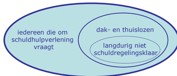
Figuur 3 dak- en thuislozen die langdurig niet schuldregelingsklaar zijn, vormen een subgroep van alle dak- en thuislozen, die op hun beurt weer een subgroep vormen van alle schuldenaren

231 Figuur 3 bevat een weergave van de indeling in groepen die we hierboven hebben uitgelegd.