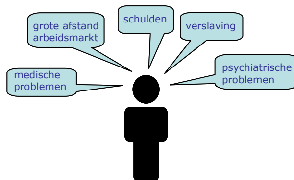
Figuur 2 dak- en thuislozen hebben doorgaans meerdere (samenhangende) problemen

105 De individuele trajectplannen hebben betrekking op de verschillende soorten problemen die dak- en thuislozen hebben. Veelvoorkomende problemen zijn verslavingen, psychiatrische problemen en medische problemen. Voor de meeste dak- en thuislozen geldt dat zij ook problematische schulden hebben. Er zijn geen landelijke cijfers bekend, maar in onderzoeken in afzonderlijke gemeenten leverden percentages op die variëren van 71% tot 79%. 2 Voor de invulling van individuele trajectplannen betekent dit dat (bijna) standaard gebruik moet worden gemaakt van het instrument Modelaanpak schuldhulpverlening en schuldsanering waar het plan van aanpak MO in voorziet.