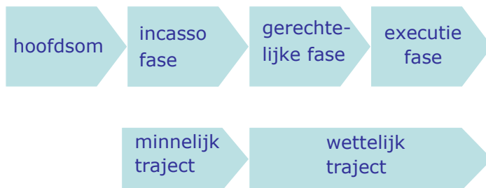
Figuur 5 opzet van het Nederlandse incassostelsel

3 Kenmerkend voor het minnelijk traject is dat er geen rechter aan te pas komt. De crediteur kan zelf invorderingskosten in rekening brengen of bijvoorbeeld een incassobureau of deurwaarder inschakelen. Als minnelijke aanmaningen niet tot betaling leiden, kan een crediteur de rechter inschakelen om betaling af te dwingen. De invordering valt dan onder het zogenaamde wettelijke traject. Incassobureaus zijn niet bevoegd om binnen dit traject te werken, dat is alleen voorbehouden aan de deurwaarder. Het wettelijk traject bestaat uit een gerechtelijke fase waarin de rechter beoordeelt of een crediteur terecht een vordering wil innen en een executiefase waarin de inning plaatsvindt (door bijvoorbeeld beslag te leggen op het inkomen of de boedel). Figuur 5 bevat een weergave van het incassostelsel.